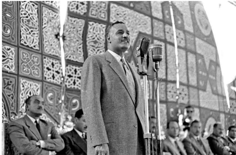
زيارة مصنع الحديد والصلب بحلوان ١٩٥٨/٧/٢٧

الصين، وماذا عملت في ١٩٤٩ .. - تأميم البنوك والمؤسسات التجارية والصناعية والسكك الحديدية، التي كانت في يد الاحتكاريين المستعمرين أو البرجوازيين؛ لتكون ملك الشعب.